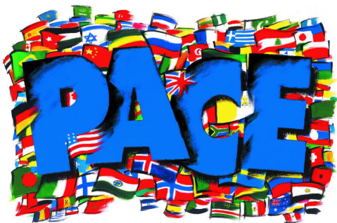
Foto appuntamento: giovedì 25 novembre 2010 con "La Pace come mezzo di risoluzione".

Scritto da La Redazione Mercoledì 10 Novembre 2010 07:44