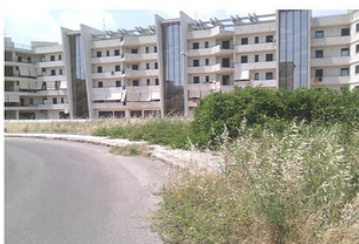
Erbacce infestanti in via della Chiusa e via Terracini