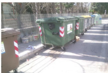
Isola ecologica in via Aldo Moro